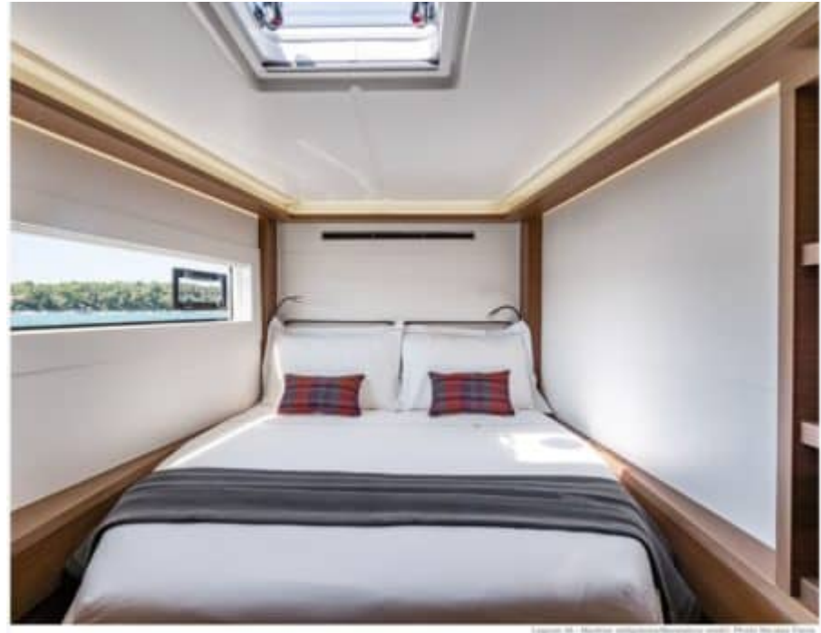
Figure 50 - Yacht Pelagia - Interior (left) - Cabin with view to sea