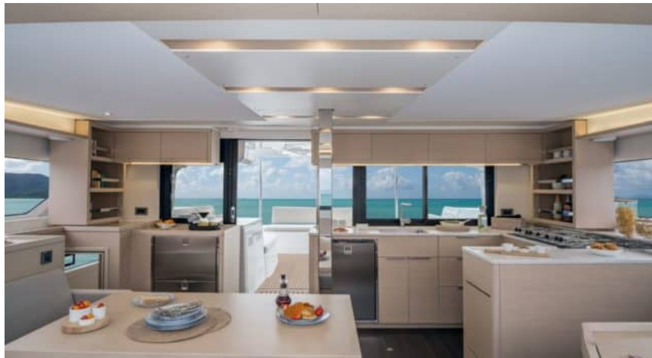
Figure 49 - Yacht Pelagia - Interior (right) - Kitchen with view to sea