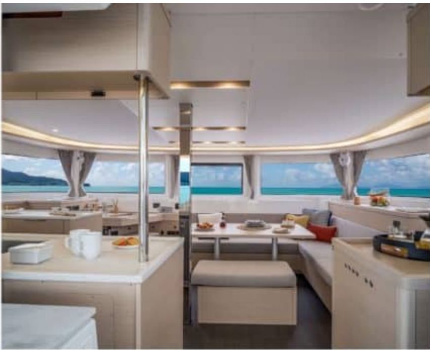
Figure 48 - Yacht Pelagia - Interior (right) - Dining with view to sea